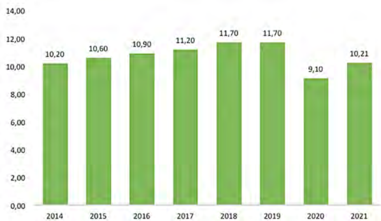
Figura 1. Evolución del % de penetración de usuarios de centros Fitness en España 2014-2021.