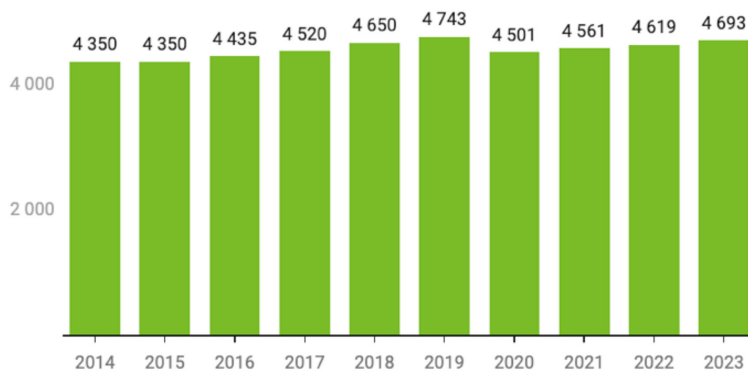
Figura 3. Evolución del número de centros Fitness en España 2014-2023.